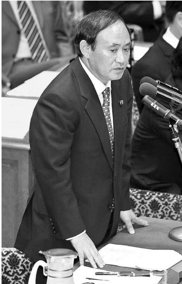
衆議院予算委員会にて